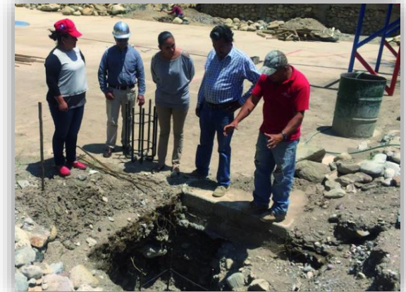
Cubierta de Captación de Agua en la Localidad de el Plátano