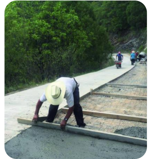
PAVIMENTACIÓN DE CALLES LOCALIDAD TIERRAS COLORADAS