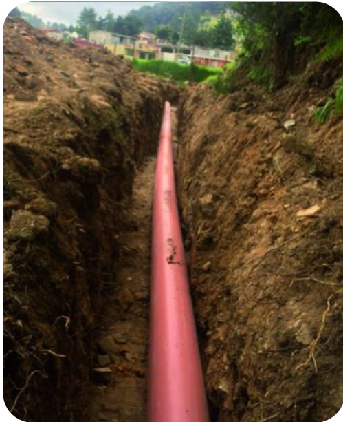
AMPLIACIÓN DE LA RED DE DRENAJE SANITARIO EN NUEVO SAN JOAQUÍN