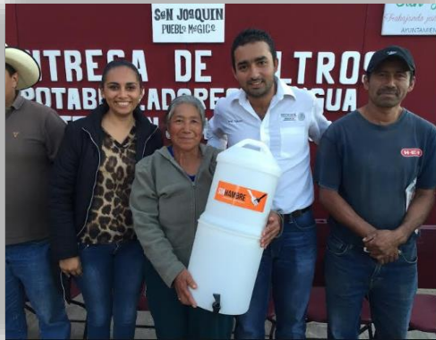
Entrega de Filtros Potabilizadores de Agua