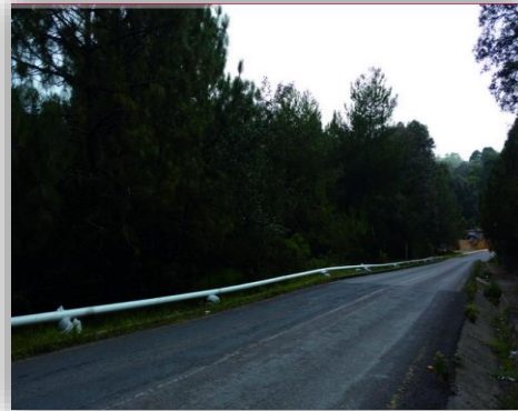
Ampliación de Sistema de Agua Potable